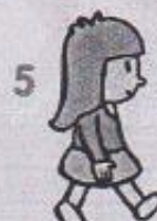
5 chůze na místě