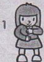
1 stoj snožmo, ruce hladí tělo