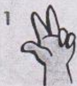
1 počítání na rukou