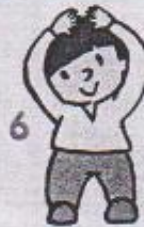
6 rukama dělat střechu nad hlavou