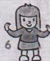
6 stoj, ruce naznačují obrys sněhuláka