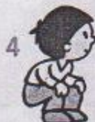
4 v dřepu, otáčení hlavou