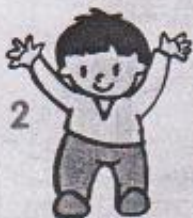
2 ruce napodobují padající sníh