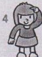
4 ukazovat rukou na aktuální část těla