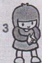
3 stoj snožmo, třít ruce o sebe