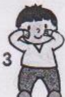
3 stoj snožmo, ruce hladí tváře