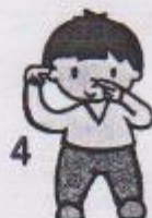
4 ruce ukazují na nos i uši