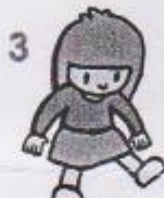
3 hýbat nohama