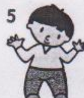
5 ruce i hlava ukazují NE