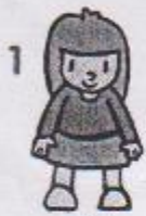
1 stoj snožmo