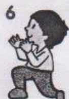
6 poskoky, ruce tleskají