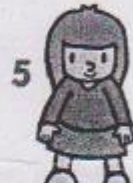
5 stoj snožmo