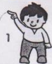
1 stoj snožmo, ruka kreslí kopec