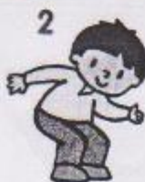
2 houpání v kolenou