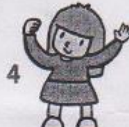
4 hýbat hlavou, rukama