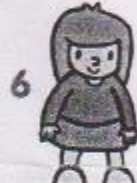
6 stoj snožmo