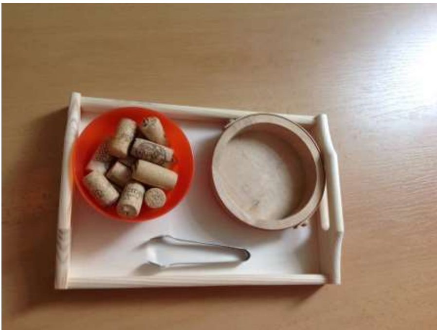
přendávání korků pinzetou