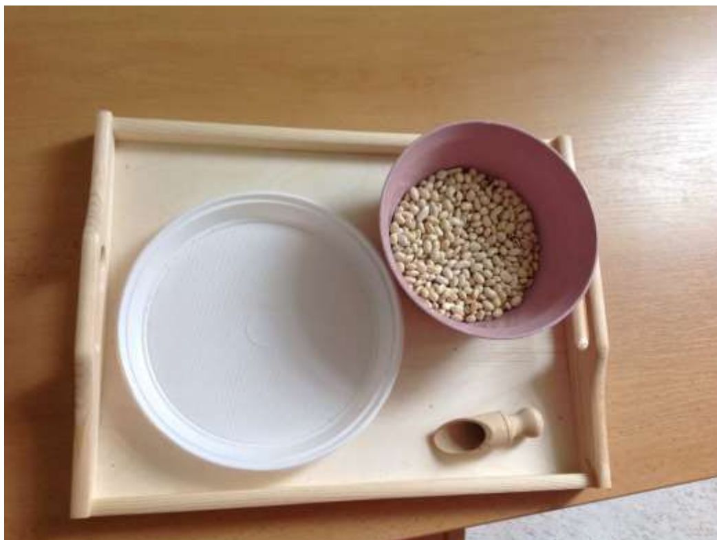
Přesýpání fazolí či burizonů malou lžičkou či naběračkou...

Nakresli si dráhu pro auto či pro kočárek: