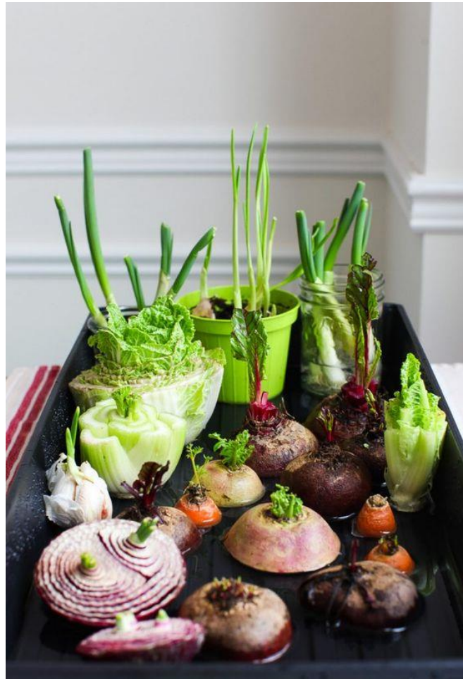
Pokus se zeleninou