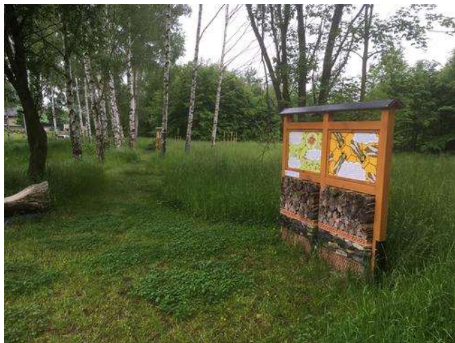
Naučná stezka Fascinující příběh medu ve Varnsdorfu

Naučná stezka vypráví hravou formou o tom, co všechno předchází tomu, než se med dostane do sklenice a kdo nebo co za to může. Stezka je složena z dvanácti obrázků s krásnými kresbami doplněnými poutavým výkladem